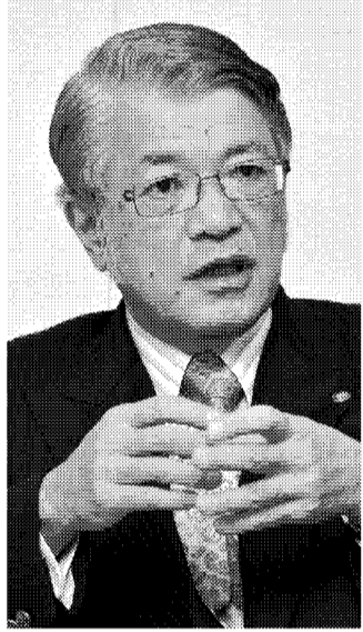
1945年生まれ。東京都出身。早稲田大学政治経済学部卒。68年東急不動産入社。86年東急ホーム取締役。98年東急不動産取締役。常務、専務を経て東急ホーム社長、東急アメニックス社長を歴任。2008年4月から現職。社団法人不動産協会副理事長、一般社団法人不動産証券化協会副会長。

社長就任は2008年4月。半年後にリーマン・ショックが起きた。06年に「東急プラザ表参道原宿」の土地... 「お客様目線」と「現場見聞」を徹底する経営者の実践。