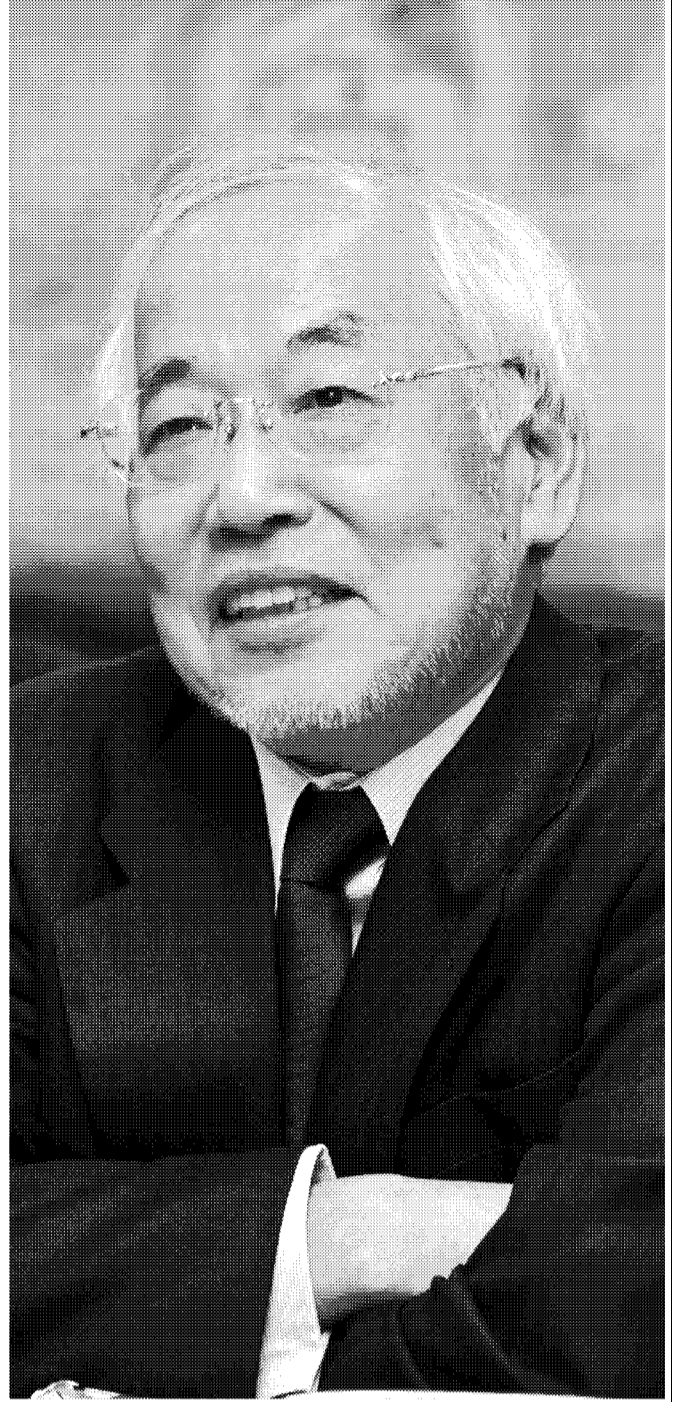
インターネットイニシアティブ 代表取締役社長