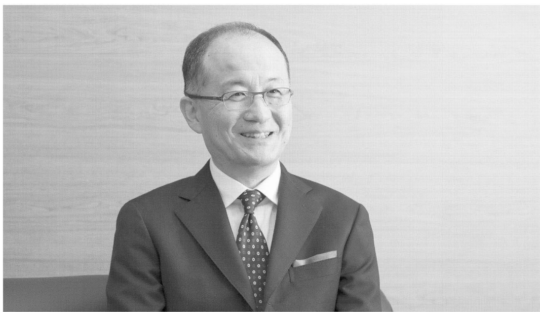
セイコーウォッチ 代表取締役社長 兼COO兼CMO

本連載「リーダーたちの本棚」が書籍化されました 『私をリーダーに導いた250冊』好評発売中 朝日新聞出版 ISBN 978-4-02-331547-1 本体価格 1500円+税