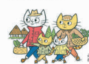
Illustration by Akira Sorimachi