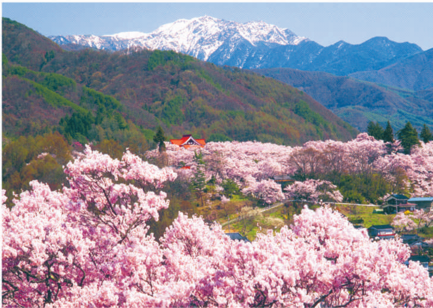
戦国から江戸時代にかけて発展した城下町高遠に咲き誇る「天下第一の桜」のタカオコヒガンザクラ