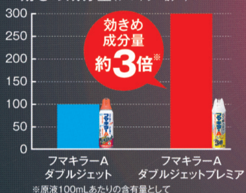
■従来品を100とした場合の効きめ成分量(フマキラー調べ)

【有効成分】d-T80-フタルスリン、d-T80-レスメトリン 【効能】蚊成虫、ハエ成虫、ゴキブリ、ノミ、トコジラミ、イエダニ、マダニの駆除